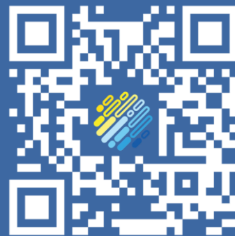
Facebook Civic Hub